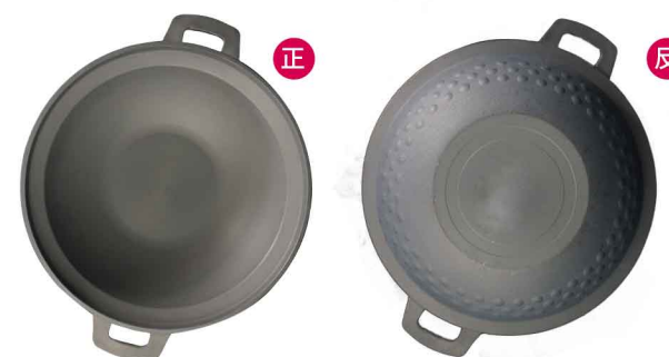
MI0106 如意湯鍋 硬陽 內徑29.5 高9 12個/箱