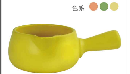
AS0814 直火砂鍋16w7 直徑11 高7 12個/件