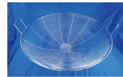
MC3001 不鏽鋼油炸網(#304) 長74 寬20.5 高29