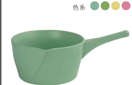
AS0808 直火砂鍋1000ml 直徑24 高9 12個/件