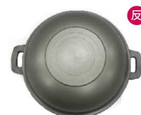
MI0105 膳喜鍋 硬陽 8吋、9吋、10吋 尺寸如圖 10個/箱