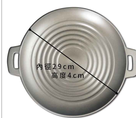
MI0104 0401烤盤 硬陽 尺寸如圖 10個/箱