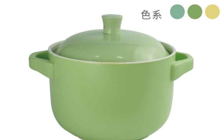
AS0812 直火砂鍋4000ml 直徑22 含蓋高19 6組/件