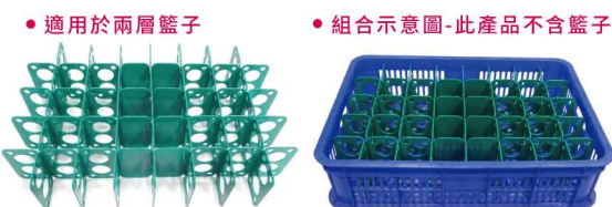
EY0105 籃子隔板-4大7小 大-長57.5 寬12.5 小-長38 寬12.5 10組/包