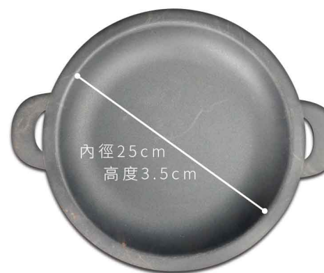
MI0103 25cm烤盤 鐵氟龍 尺寸如圖 10個/箱