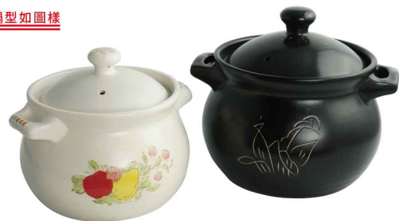
AS0733~44 K303~K313砂鍋 AS0744-K311-長20 寬16 含蓋高16 (1.7L) 12個/件 AS0740-K310-長22.4 寬17.8 含蓋高18 (2.2L) AS0739-K309-長24.5 寬19 含蓋高20.5 (3.5L) 8個/件 AS0733-K303-長28 寬22 含蓋高20.5 (5L) 8個/件 AS0743-K313-長30 寬23.7 含蓋高23 (6L) 6個/件 AS0738-K308-長30 寬24.7 含蓋高25 (8L) 4個/件 AS0738-(K308-3)長40.5 寬32.3 含蓋高30 (12L) 2個/件