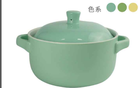
AS0811 直火砂鍋3300ml 直徑22 含蓋高17.5 6組/件