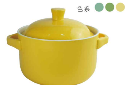
AS0813 直火砂鍋5000ml 直徑24 含蓋高22 4組/件