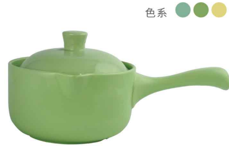
AS0810 直火砂鍋1800ml 直徑17.5 含蓋高14 8組/件