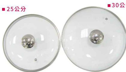
QE0101 高弧玻璃蓋 大:直徑30 30個/箱 小:直徑25 20個左右/箱