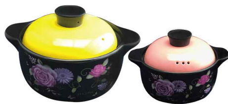
AS0342 韓式烤花鍋 8吋:寬26 高17 直徑20 6個/件 9吋:寬28 高17 直徑22 6個/件 10吋:寬32 高17 直徑25 4個/件