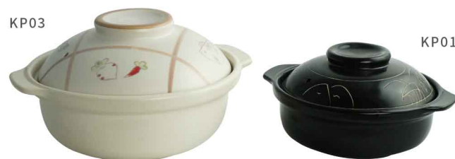
AS0711~19 KP01~KP09砂鍋 AS0711-KP01-長20.3 寬17.4 含蓋高9.5 6個/件 AS0712-KP02-長22.5 寬18 含蓋高11.2 20個/件 AS0713-KP03-長24.8 寬21.7 含蓋高13 (1.5L) 16個/件 AS0714-KP04-長28.8 寬25 含蓋高14.2 (2L) 10個/件 AS0715-KP05-長32.7 寬29 含蓋高17 (3L) 8個/件 AS0716-KP06-長36 寬31.7 含蓋高17.5 6個/件 AS0717-KP07-長38.7 寬34.3 含蓋高18 6個/件 AS0718-KP08-長37 寬42 含蓋高21.5 (5.5L) 4個/件 AS0719-KP09-長46.5 寬41 含蓋高22.5 3個/件