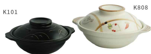
AS0708~10 K101/K808/K909砂鍋 AS0710-K101-長16 寬13.7 高6.5 AS0708-K808-長28.5 寬24.7 高11 (1L) 10個/件 AS0709-K909-長32 寬28 高12.3