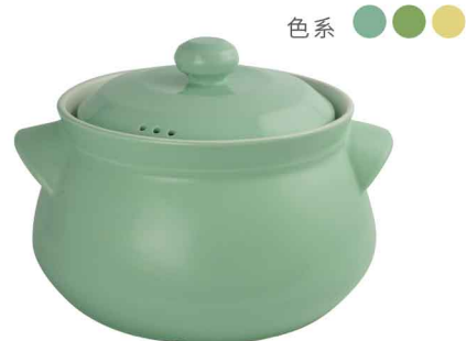
AS0809 直火砂鍋3000ml 直徑19.5 含蓋高17.5 6組/件