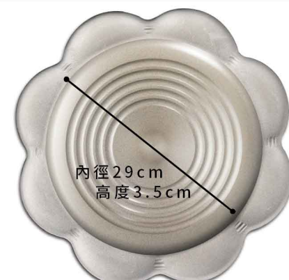
MI0102 花型陶板 硬陽 外徑38 尺寸如圖 15個/箱